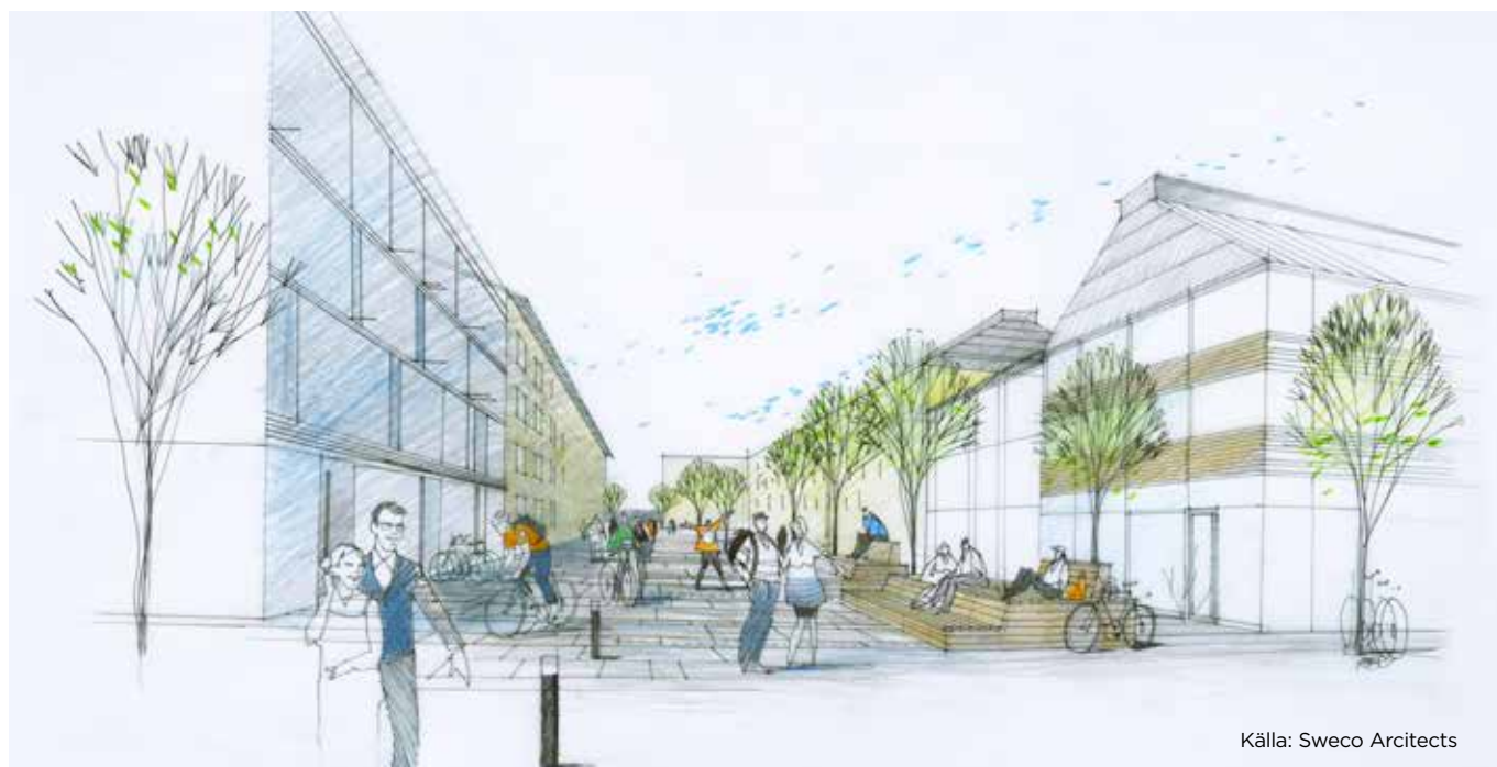
Illustrationerna är inspirationsskisser och redovisar inte slutlig utformning.