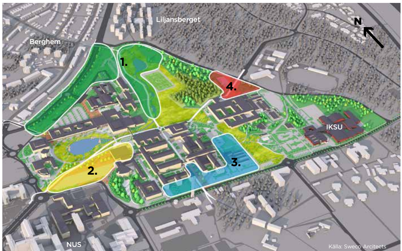
1. Norra campus. 2 Centrala parkrummet. 3. Södra campus. 4. Behandlas ej av campusplanen

Områdena kännetecknas av att det i dessa delar av huvudcampus identifierats utvecklingsbehov. Varje nytt inslag som tillförs i dessa områden bidrar till de bärande principerna i campusplanen och till en utveckling av huvudcampus som helhet.