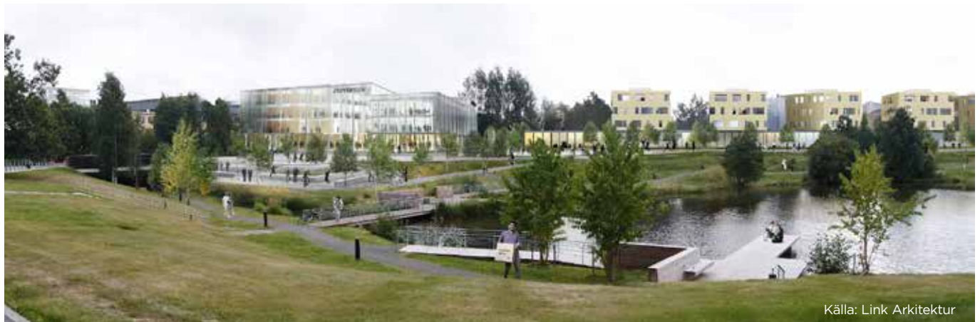
Illustrationerna är inspirationsskisser och redovisar inte slutlig utformning.